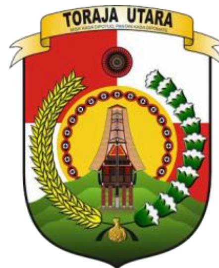
Kabupaten Toraja Utara