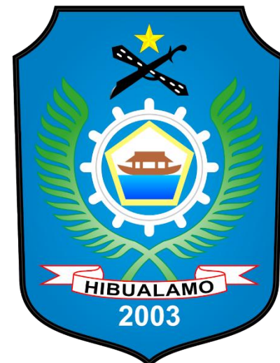
Kabupaten Halmahera Tengah