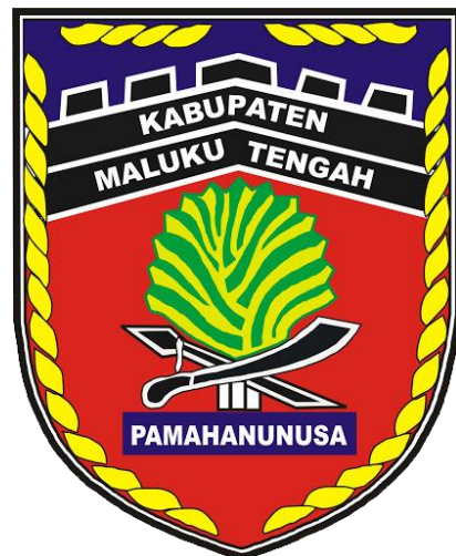
Kabupaten Maluku Tengah